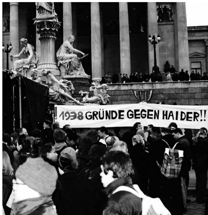
Einst und heute – ‚Verstaubung‘ des politischen Aktivismus bei GEDENKDIENTST!? Links: Demo unter dem Motto „Keine Koalition mit dem Rassismus“ am 12. November 1999 vor dem Parlament in Wien. Rechts: das Transparent zwölf Jahre später im Keller des Autors.