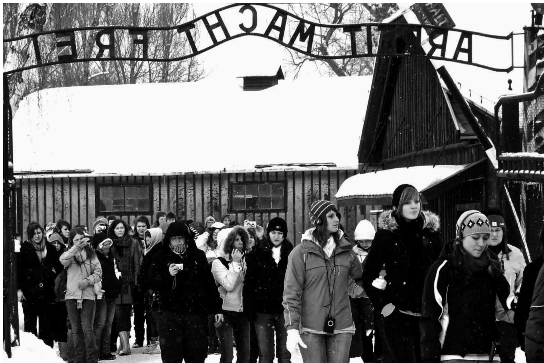
Studienfahrt nach Auschwitz, Februar 2009